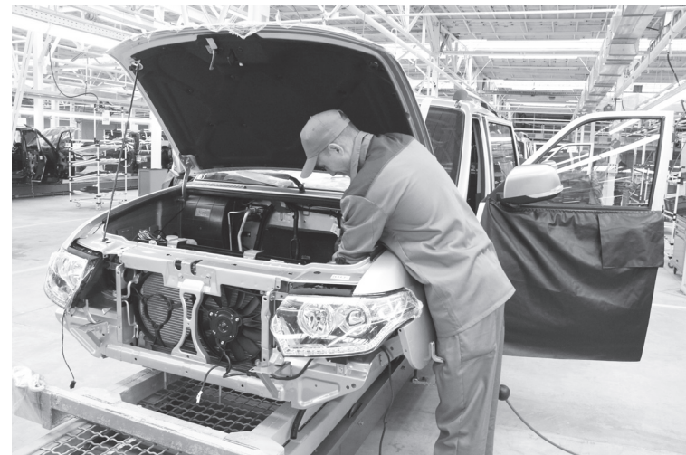
В Ульяновской области продолжает расти индекс промышленного производства. В январе - феврале показатель составил 102,3% по сравнению с аналогичным периодом предыдущего года.

На увеличение индекса в регионе наибольшее влияние оказали обрабатывающая отрасль, где его значение достигло 103,3%, обеспечение электрической энергией, газом и паром; кондиционирование воздуха - 101,2%, добыча полезных ископаемых - 100,8%.